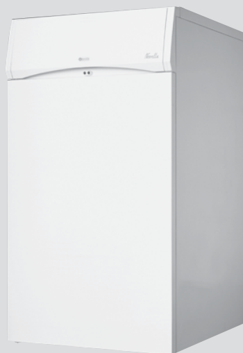
Kit - multisetorização (opcional)